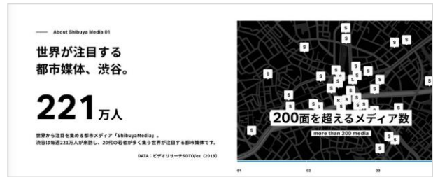
About Shibuya Media

日本の中でも世界から注目を集めている渋谷。 性年代別の来訪者数や職業、乗降客数、企業の 開業率などデータで渋谷をご紹介します。