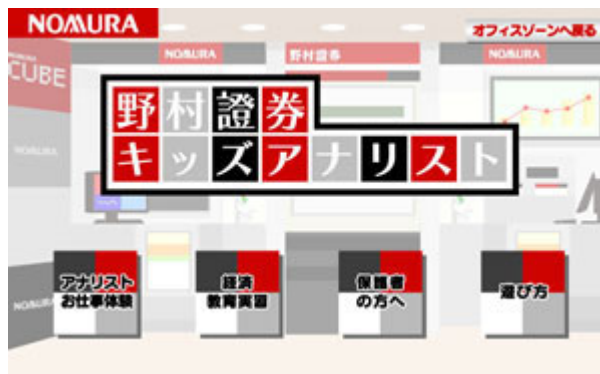
「ノムラキューブ」に入店すると、「キッズアナリスト」のお仕事体験が用意されています。