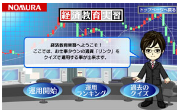
研修を経て「キッズアナリスト」の認定を受けると、資産運用が体験できる経済クイズにチャレンジできます。