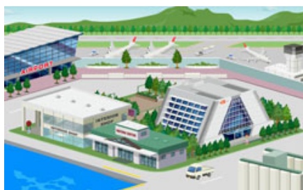
【臨海エリアイメージ】