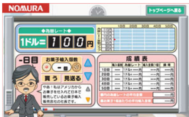
まずは、「キッズアナリスト」になる為の研修を受けます。画面は、為替のルールを体験するゲーム画面です。