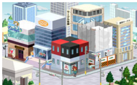
【オフィスエリアイメージ】

お仕事タウンでは、テーマに沿った「オフィスエリア」「商業エリア」「臨海エリア」「エコエリア」「パブリックエリア」の5つのエリアにより構成されており、各アトラクションがテーマに合わせて配置されます。