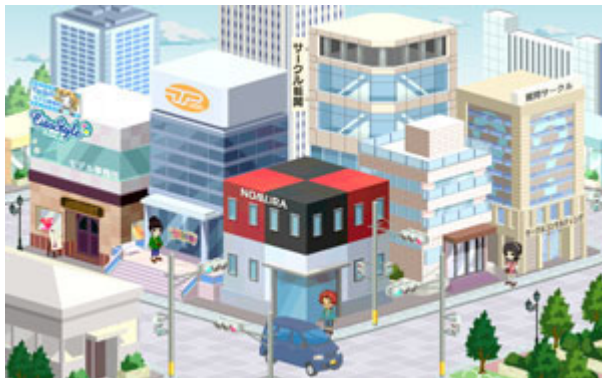
オフィスエリアに「ノムラキューブ」の施設が登場！

お仕事体験ゲームを通じて為替・資産運用を体験することで、子供達に「経済」の知識を提供します。