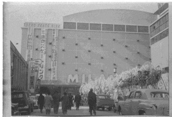
▲開業当時の「新宿東急文化会館」