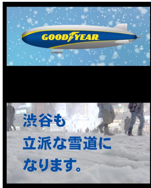
渋谷スクランブル交差点 Q's EYE