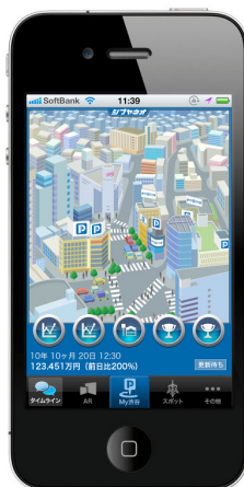
<ゲーム画面イメージ>