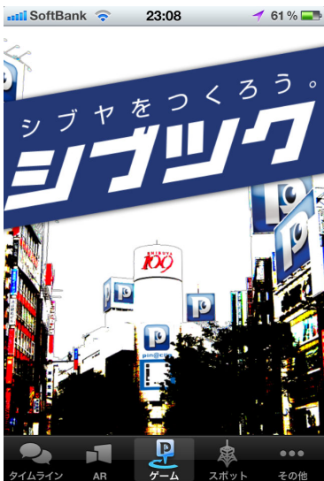
<ゲーム TOP イメージ>

利用者は、実際の店舗に設置されている AR マーカ『ピナクリマーカー』を読み込むことにより、ゲーム内の渋谷に、現実に存在するお店を誘致することができます。ゲーム内の渋谷での売上をアップさせることで、ランキングの TOP を目指します。