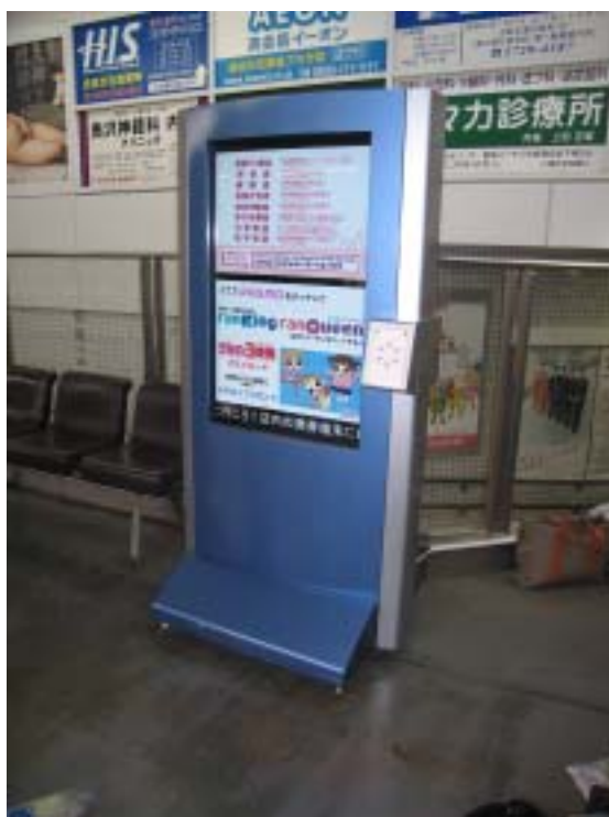
リーダ付きディスプレイ (大井町線自由が丘駅下りホーム)