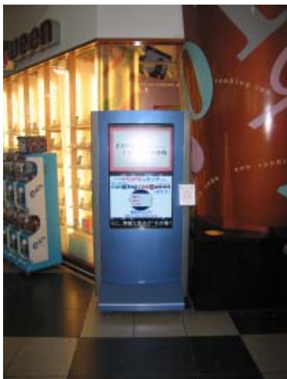
リーダ付きディスプレイ (ランキンランキン渋谷店店頭)