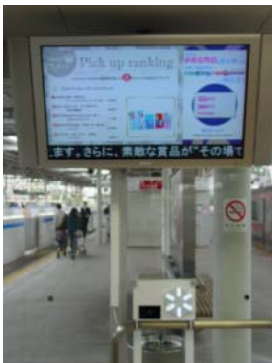
リーダ付きディスプレイ (東横線・目黒線多摩川駅上りホーム待合室)